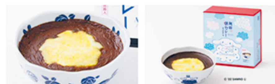
マップNo. 89 有田テラス マップNo. 129 有田銘品館 有田町中の原1-7-18 JR有田駅構内

第7回JRR九州駅弁グランプリなど数々の受賞歴がある「有田焼カレー!」カレー愛を巻き起こした有田駅長がおすすめる本格派焼カレーです。身体に優しい28種類のスパイスと佐賀牛を使用しじっくり煮込んだルーは、深い味わいとスパイスの香りが特徴。お米は13年連続で特A評価の佐賀県産米「さがびより」を使用。地産地消にこだわり、チーズを乗せて焼き上げた本格派の「有田焼カレー」です。アフターユースできるオリジナルの器も付いてとってもお得。