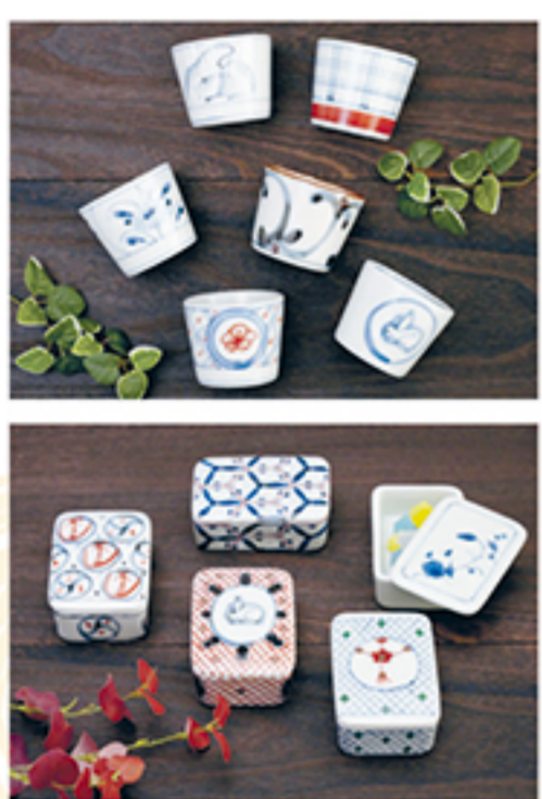
マップNo. 101 大日窯 有田町岩谷川内1-2-12 ☎090-1713-2431

大日窯は、有田焼では唯一の日本民藝協会が指定する「民藝の窯元」です。昔ながらの天然原料を使って呉須、釉薬、赤絵を使い、初期伊万里をモチーフとした素朴で温かみのある、唯一無二の手描きの日用食器が特徴です。蕎麦猪口は、湯飲みや小鉢としても使え、ヨーグルトなどを入れてもGood! お菓子や漬物、明太子入れとしても使える蓋物もおすすめ。バターケースもあって、実用的でデザインもかわいい!