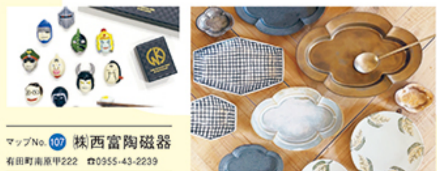
マップNo. 107 狭西富陶磁器 有田町南原甲222 ☎0955-43-2239