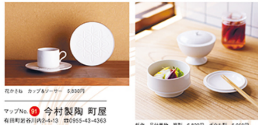
マップNo. 91 今村製陶 町屋 有田町岩谷川内2-4-13 ☎0955-43-4363