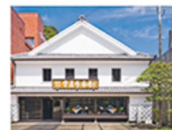
マップNo. 86 買美堂本店 有田町中の原1-1-13 ☎0955-42-5100