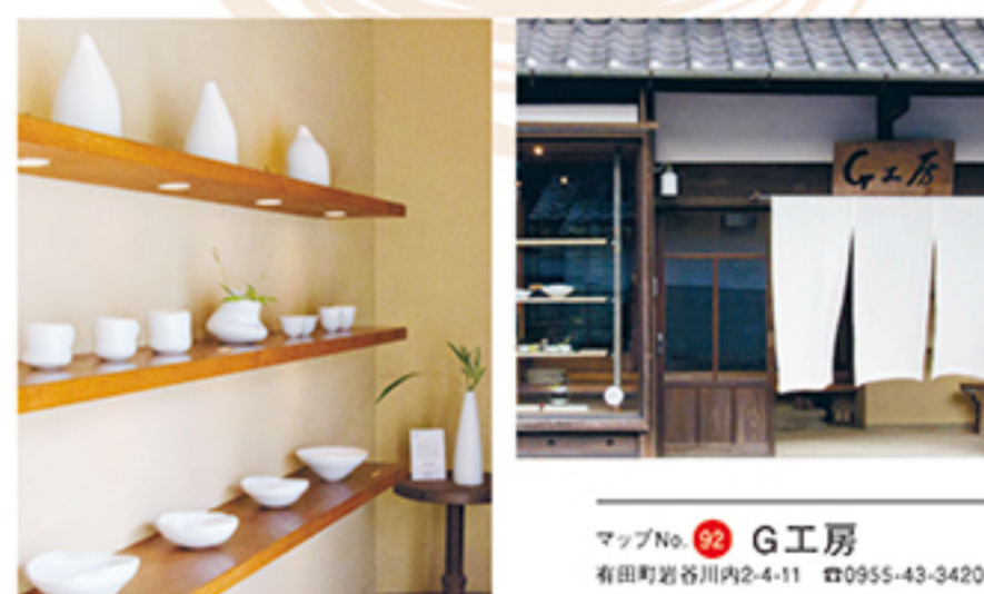
マップNo. 92 G工房 有田町岩谷川内2-4-11 ☎0955-43-3420

有田の伝統的な街並みにある白磁と彫金の工房ギャラリーです。ひとつひとつ作家の手によって仕上げられた、日々の暮らしを豊かにする美しい白磁のうつわと銀のアクセサリーをぜひ手に取ってご覧ください。