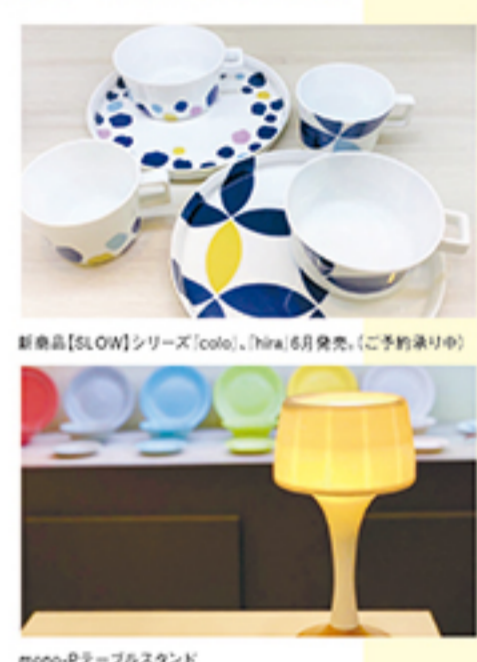
マップNo. 65 66 136 香蘭社 有田町幸平1-3-8 ☎0955-43-2132

by korانشaより新商品が6月に誕生します。新形状の【SLOW】シリーズは、ゆっくりとした時間の中で「食べること」をこの器と共に楽しみながら過ごしていただきたいという思いから、「colo」と「hira」の2種類の展開です。陶器市では、ひと足早くお披露目いたします。