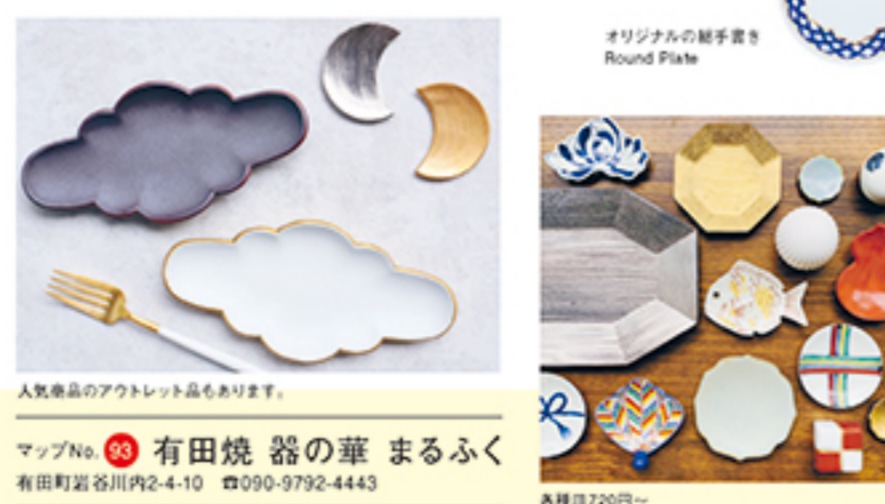
マップNo. 93 有田焼 器の華 まるふく 有田町岩谷川内2-4-10 ☎090-9792-4443

若い世代の方にも人気な大人可愛いアイテムが盛りだくさん!陶器市期間中は人気商品やアウトレット商品をお得にGETできます。三代目で器えらびを楽しんでいたお店です。広い店内なので、ゆっくりお買い物をお楽しみください。