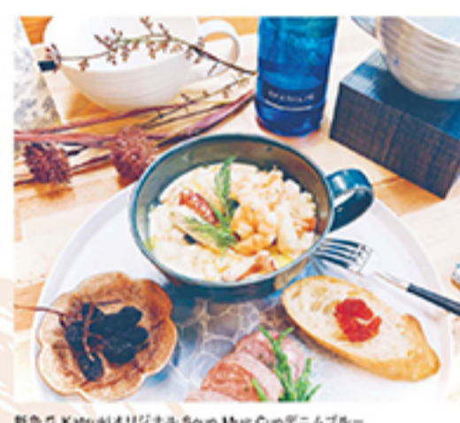
新色7 Katsukiオリジナル Soup Mug Cup デニムブルー

有田焼の老舗 藤木陶仙堂は「暮らしの器と食」をテーマに、有田焼の魅力をモダンにアレンジしたオリジナル食器など、様々な窯元の食器を扱っているお店です。有田陶器市でしか出会えない「限定品」も続々登場! 毎年大人気の「器の詰め放題」は、家庭用からホテル向け食器まで、善後はお会いできない商品もたくさん! 早い者勝ちですよ!