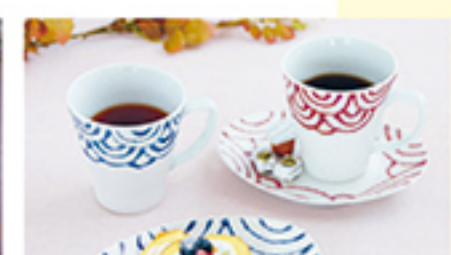
マップNo. 58 鷹巣瑞光堂 有田町赤松町幸平1-2-31 ☎0955-42-2380