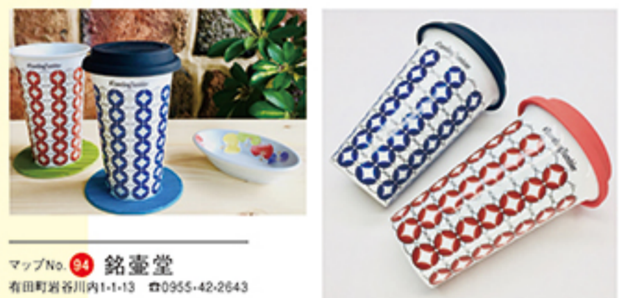
マップNo. 84 銘壺堂 有田町岩谷川内1-1-13 ☎0955-42-2643

旅先はもちろん、オフィスでも大活躍しそうなタンブラー。シリコンのキャップが付いていてソフトドリンクはもちろん、キャップ無しで使うとアルコールもいただける。絵柄は、伝統的な「七宝(しっぽう)つなぎ」、円満や子孫繁栄などとても縁起の良い文様で、ギフトにもピッタリ。有田陶器市期間中に購入すると、シリコンキャップを追加でプレゼントしてくれる。