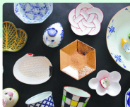
お洒落なデザインのカラーマグカップとソーサー

有田焼は、古くから「白磁」の産地として知られてきました。その伝統的な美しさを現代の生活に合わせるべく、最新のデザインと技術を取り入れた「スタイリッシュな有田焼」を開発しました。白磁の清潔感と、色鮮やかなデザインが、現代のインテリアにぴったりです。また、機能性を重視し、保温性や耐久性を向上させた製品も数多くあります。伝統と現代の融合が、有田焼の新たな魅力を演出しています。