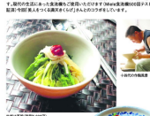
服丈と受け継ぐ「陶祖の血筋」

「あなたに合う器が見つかる」というコンセプト。様々なデザインで美しく見せたいという思いが込められています。昔の陶器は土に削った土をすりつぶし、あらいこき、窯の温度次第で釉薬の発色や変化した土をくり返します。そして「釉薬の発色」を再現しようとデザインを考案して生まれる男のフィギュアやアンダー、大変な方の陶器作りにも力を入れています。