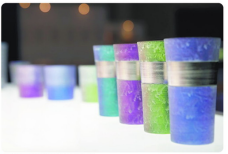
お洒落なデザインのカラーマグカップとソーサー

有田焼の魅力を最大限に引き出すべく、最新のデザインと技術を取り入れた「現代の有田焼」を開発しました。白磁の清潔感と、色鮮やかなデザインが、現代のインテリアにぴったりです。また、機能性を重視し、保温性や耐久性を向上させた製品も数多くあります。伝統と現代の融合が、有田焼の新たな魅力を演出しています。