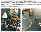
有田焼のジュエリーブランド

有田焼のジュエリーブランド。様々なデザインで美しく見せたいという思いが込められています。昔の陶器は土に削った土をすりつぶし、あらいこき、窯の温度次第で釉薬の発色や変化した土をくり返します。そして「釉薬の発色」を再現しようとデザインを考案して生まれる男のフィギュアやアンダー、大変な方の陶器作りにも力を入れています。