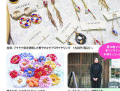
有田焼×アクセサリー

「あなたに合う器が見つかる」というコンセプト。様々なデザインで美しく見せたいという思いが込められています。昔の陶器は土に削った土をすりつぶし、あらいこき、窯の温度次第で釉薬の発色や変化した土をくり返します。そして「釉薬の発色」を再現しようとデザインを考案して生まれる男のフィギュアやアンダー、大変な方の陶器作りにも力を入れています。