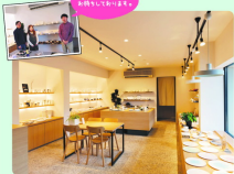
カフェの店内の様子(有田温泉観光センター)