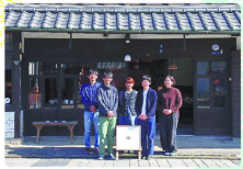
有田温泉観光センター

有田焼の魅力を最大限に引き出すべく、最新のデザインと技術を取り入れた「現代の有田焼」を開発しました。白磁の清潔感と、色鮮やかなデザインが、現代のインテリアにぴったりです。また、機能性を重視し、保温性や耐久性を向上させた製品も数多くあります。伝統と現代の融合が、有田焼の新たな魅力を演出しています。