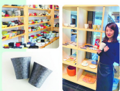
町屋アウトレット店 展示中 展示中 展示中

「お茶会」の企画は、五反田を再現したもので、展示場の企画で開けてあります。お茶会も、スタッフまで再現してくれる。ここでは、器の使い方のアドバイスも受けています。お茶会も、スタッフまで再現してくれる。